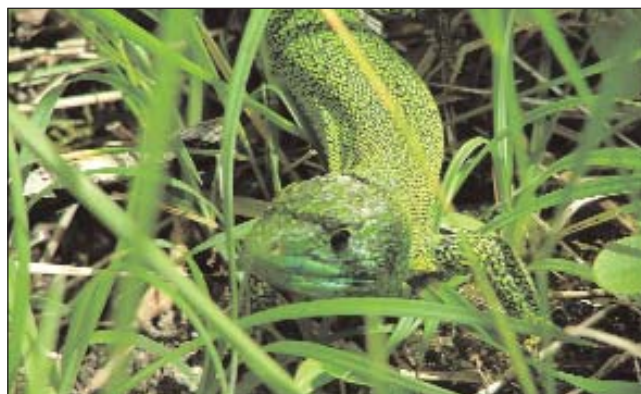
Lézard vert occidental ( Lacerta bilineata )