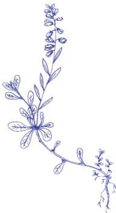
Polygala du calcaire ( Polygala calcarea )

Les objectifs de gestion sont d'éviter les rejets sur les zones déboisées et débroussaillées, limiter la litière sèche en été pour éviter les départs de feux, d'ouvrir le couvert herbacé, d'appauvrir le sol, de revenir à des formations plus typiques des pelouses sèches calcicoles et plus riches en espèces et d'affaiblir les pieds de Lierre avant les travaux de restauration.