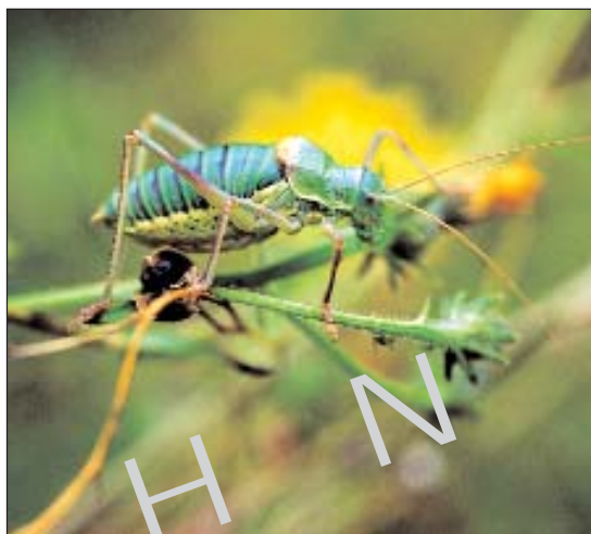
Ephippigère des vignes ( Ephippiger ephippiger )

Les objectifs de gestion sont le maintien et la restauration d'un vaste espace pelousaire et de son cortège d'espèces remarquables, le maintien d'une diversité structurale et l'amélioration des connaissances sur le site.