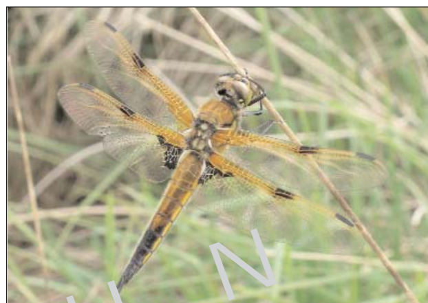
Libellule à quatre taches ( Libellula quadrimaculata )